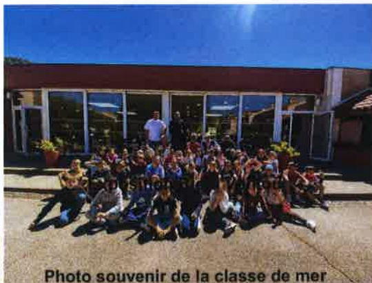
Photo souvenir de la classe de mer Le Lavandou, du 15/04 au 19/04