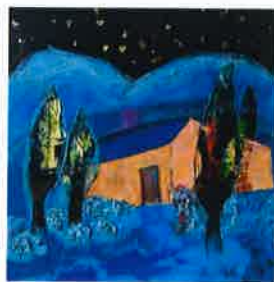
Les Bleus de la nuit