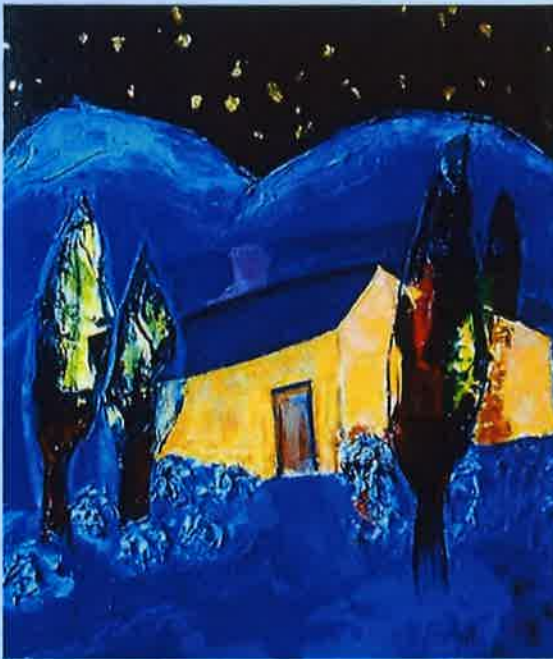
Andrée DE FREMONT